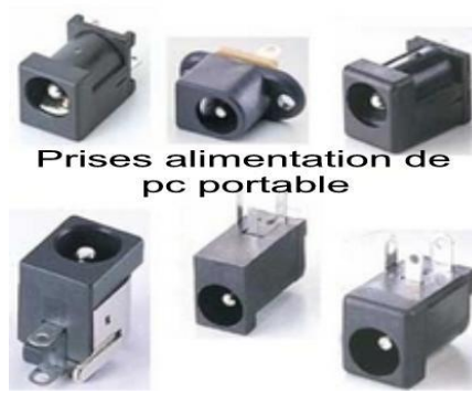
Prises alimentation de pc portable

30€ ttc prises alimentation pour pc portable