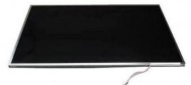
Dalles PC portables