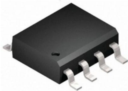
Circuits intégrés de surface