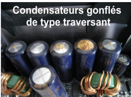
Condensateurs gonflés de type traversant

NOUS EFFECTUONS LE MONTAGE DE TOUTES LES PIECES ELECTRONIQUES ACHETEES SUR INTERNET.