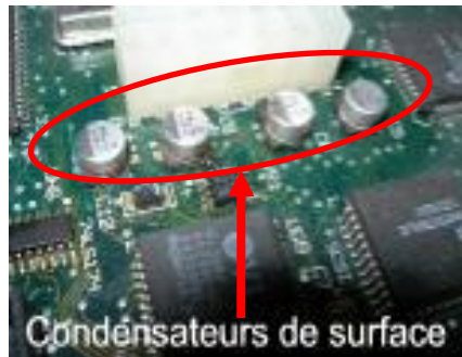
Condensateurs de surface